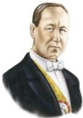
Enrique Olaya Herrera (1930-1934)